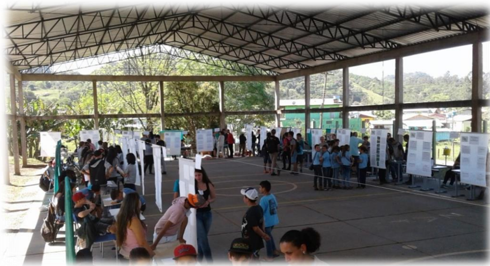
Figura 1: Feira da Escola Estadual Felisberto Luiz de Oliveira

Os resultados das investigações, desenvolvidas em sala de aula, num primeiro momento são comunicados no âmbito da própria escola (figura 1). Posteriormente, os melhores escolhidos pela aquela comunidade escolar os representam, participando da feira municipal (figura 2).