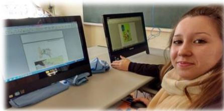
Figura 4: Hora de rever as receitas agroecológicas aprendidas nas oficinas com o técnico agrícola