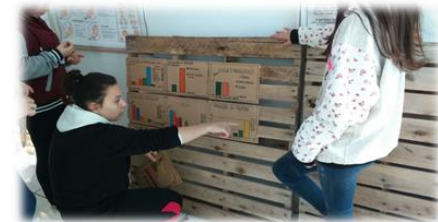
Figura 8: Gráficos produzidos pelos alunos, foram expostos em palets por serem um material que estes têm facilidade em obter junto à madeira local (que também fornece a serragem para a composteira)