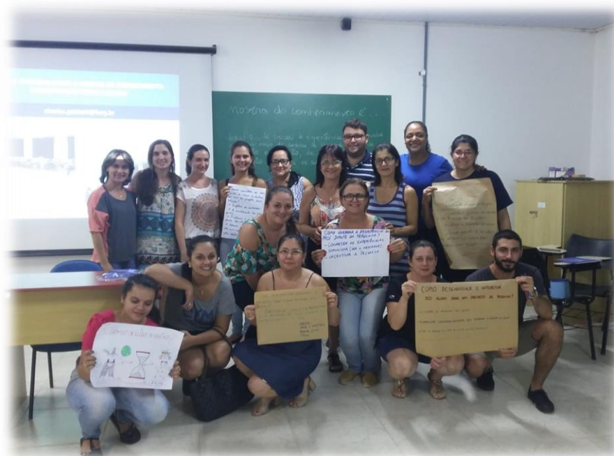
Figura 4: Roda de conversa sobre a mostra do Conhecimento de SAP

Registro a partir de Moraes et al. (2012), que a construção de compreensões necessita ser comunicada, assumindo assim a importância do coletivo no exercício da validação das novas verdades produzidas no processo formativo. Desse modo, na terceira semana os professores foram desafiados a construir cartazes comunicando as compreensões construídas entorno do desenvolver projetos de investigação em sala de aula.