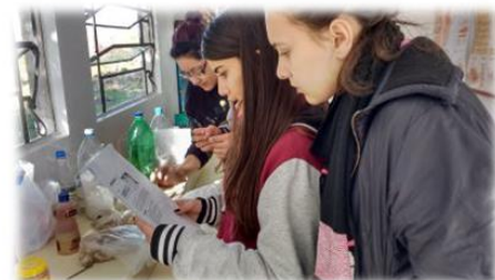
Figura 4: Hora de rever as receitas agroecológicas aprendidas nas oficinas com o técnico agrícola