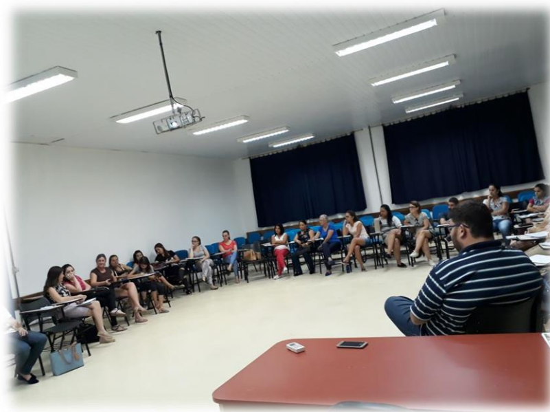
Figura 3: Roda de conversa sobre a mostra do Conhecimento de SAP

A conversa na roda começou a contar do desafio dos professores em registrar em seus cadernos e de partilhar com o grupo de professores as suas