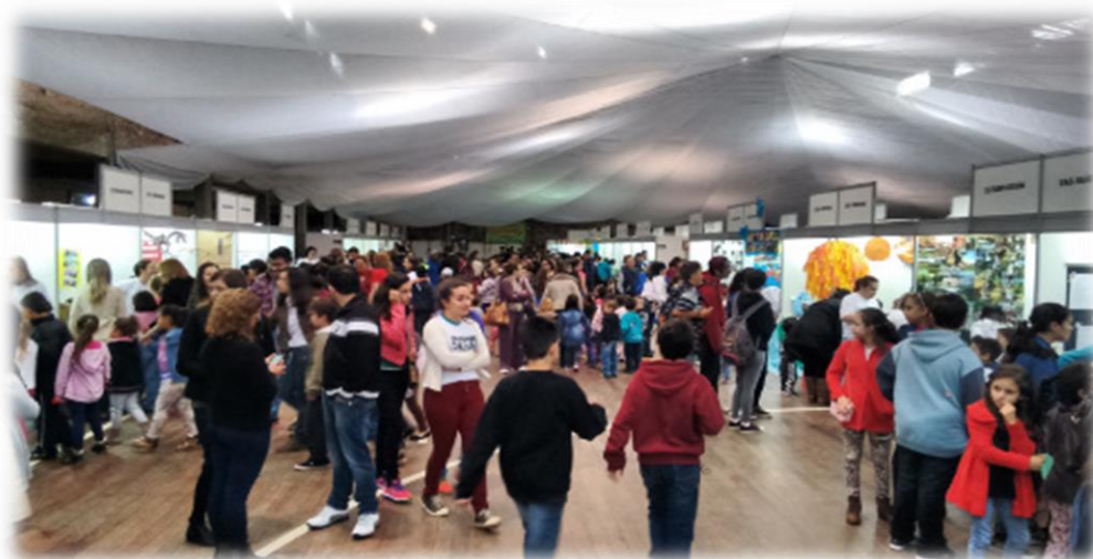
Figura 2: Mostra de Ciências e do Conhecimento de Santo Antônio

Desde 2009, a MCCSAP incentiva professores e estudantes o desenvolvimento de projetos científicos, culturais e tecnológicos desde os primeiros anos escolares, através da criação de espaços e tempos de interação entre universidade e escola, estimulando o interesse dos estudantes e professores pela pesquisa e estudos das Ciências de forma criativa, crítica e inovadora. Desse modo, a MCCSAP tem revelado novos talentos e gerando oportunidades formativas a todos os envolvendo, tornando a mostra um dos principais eventos da cidade de Santo Antônio da Patrulha.