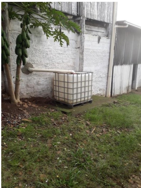
Figura 1: Imagem registrada na Usina de Reciclagem de SAP

assunto. Um dos grupos gostaria de saber o destino do lixo da escola, então fomos visitar a Usina de Triagem do lixo de Santo Antônio da Patrulha. Chegando lá, observamos todo o processo e recebemos orientações do responsável da empresa sobre o destino de todo o lixo. Durante a visita, o grupo demonstrou interesse pelo destino do chorume, já que fomos informados que esse líquido é poluente e precisamos pensar em como evitar sua produção ou até mesmo, como torná-lo útil. Percebemos que ao lado do reservatório de chorume havia um pé de mamão carregado de mamões, aparentemente saudáveis. Então surgiu a pergunta? Se o chorume polui por ser tóxico, será que podemos comer aqueles mamões?